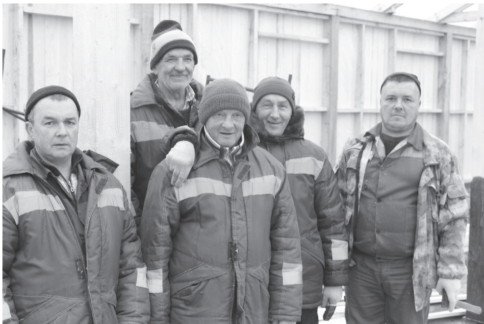
На фото: бригада строителей ООО «Скалинский»