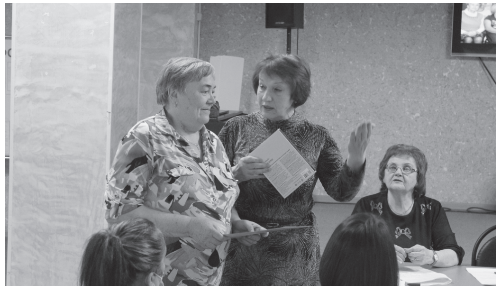
На фото: вручение почетной грамоты от Совета ветеранов