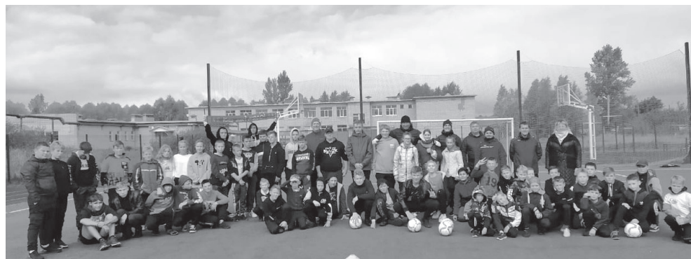
На фото: футбольные сборные школ района