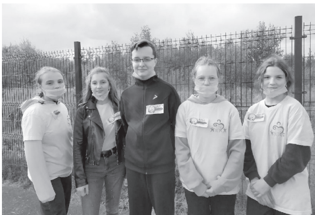
На фото: волонтеры Шильпуховской школы

Федеральный пилотный проект «Футбол в школе» на базе Шильпуховской основной школы стартовал!