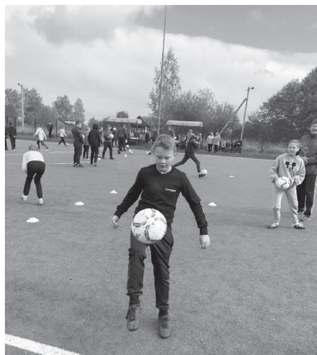
На фото: во время тренировки

Праздник футбола состоялся! Ребята возвращались домой в отличном на-