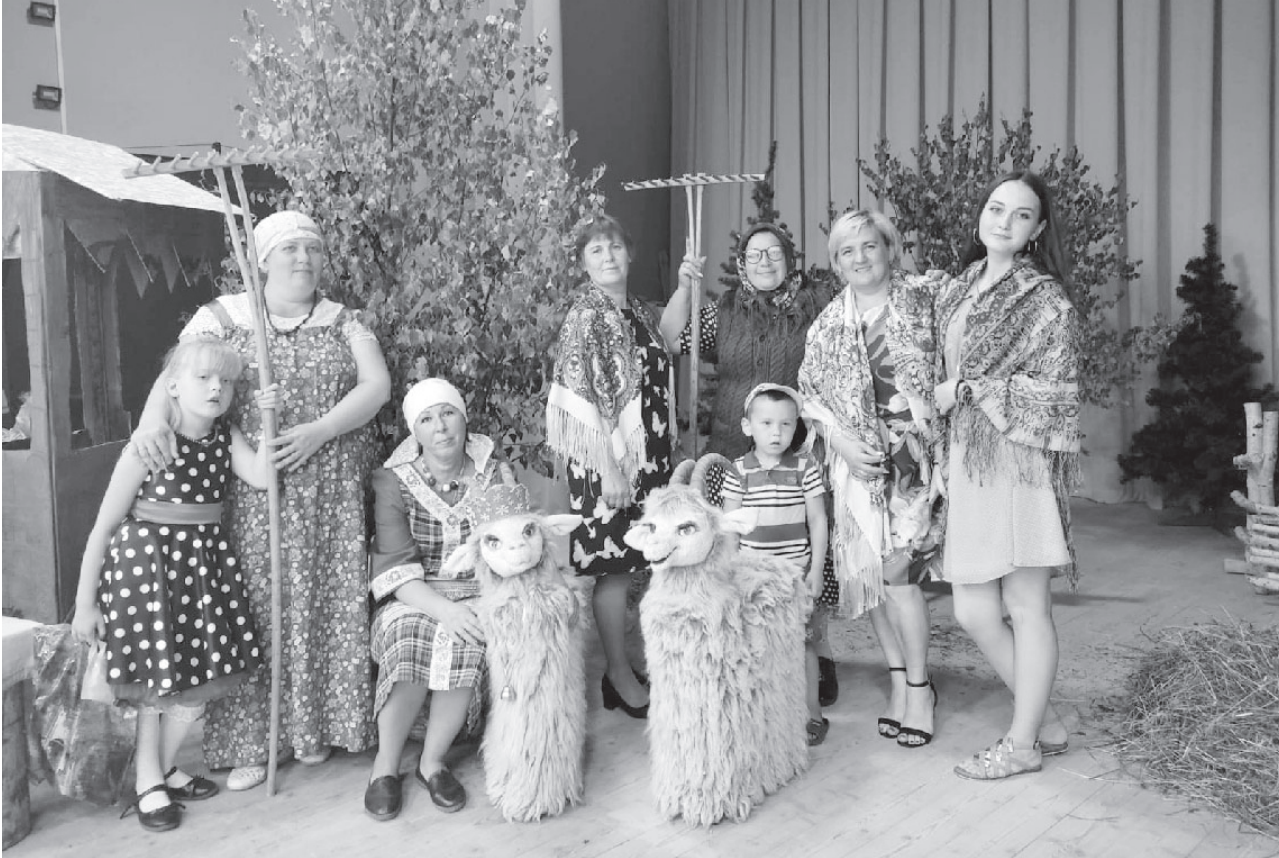
На фото: участницы театральной постановки

17 июля козяне и гости села отметили один из самых своих любимых праздников — День села