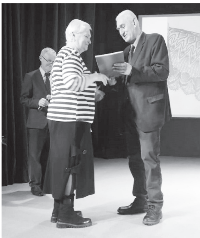
На фото: вручение диплома

Неделю назад, 14 декабря, в Доме культуры «Строитель» города Ярославль состоялась торжественная церемония подведения итогов декоративно-прикладного творчества ветеранов Ярославской области «Тепло сердец в твореньях рук», что проходил в рамках фестиваля художественного творчества ветеранов «Искусство не стареть».