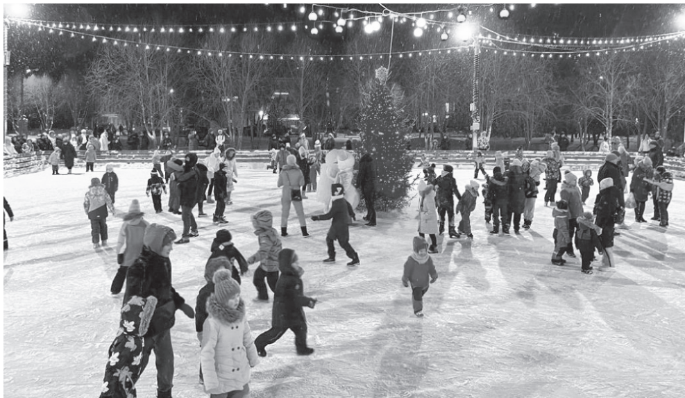
На фото: новый каток в Пречистом

15 декабря в Пречистом торжественно открыли новый ледовый каток