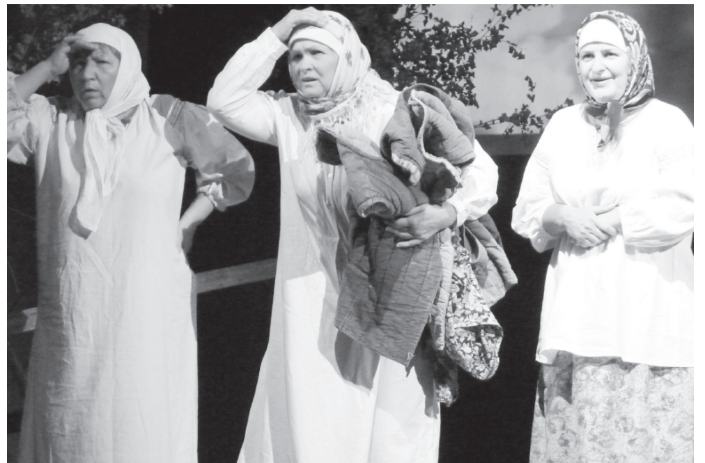
На фото: сцена из спектакля «Марьино поле»