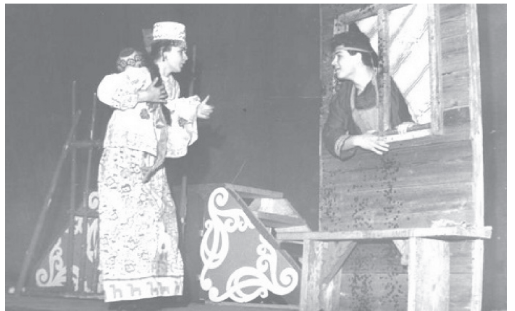
На фото: сцена из спектакля «Блоха»

Сейчас самодеятельные актеры Пречистенско-