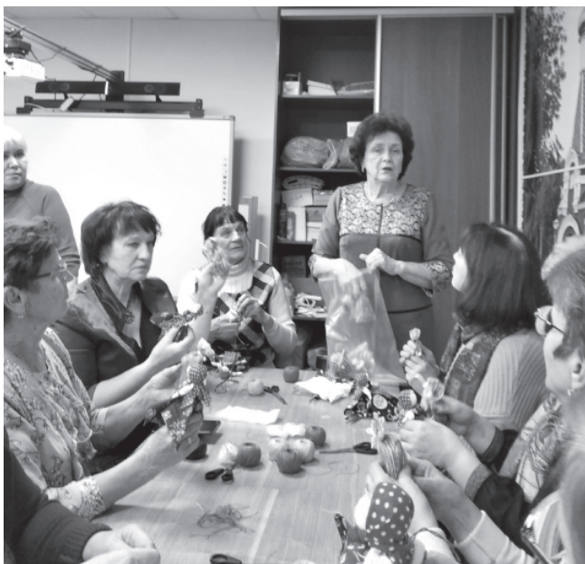
На фото: в гостях у клуба «Берегиня»

Мама. Для всех нас это самое дорогое слово в любом возрасте. Любая мать всеми способами стремится оградить семью от нега-