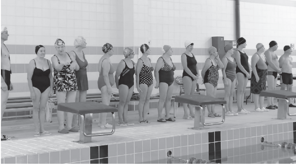
На фото: команды на старте

Болеельщики и участники – все были одинаково счастливы.