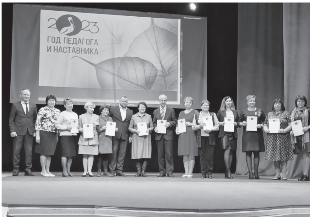
На фото: чествование руководителей образовательных учреждений

Октябрь в российском календаре богат на праздники. В первый четверг десятого месяца года, 5 октября, мы отмечаем праздник детства – День учителя. Почему детства? Да потому, что именно с этим временем связаны у нас чудесные школьные годы: где-то беспокойные, где-то напряженные, но интересные и навсегда остающиеся в нашей памяти.