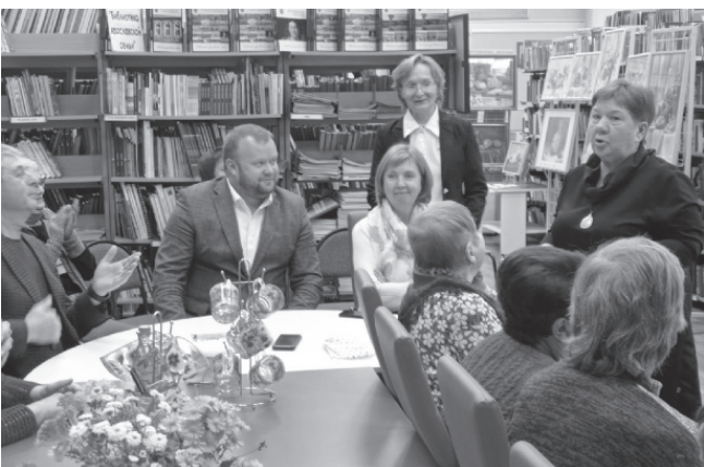
На фото: встреча активистов

3 октября в Центральной библиотеке состоялась встреча активистов районной организации общества инвалидов, посвящённая 35-летию создания Всероссийской организации инвалидов