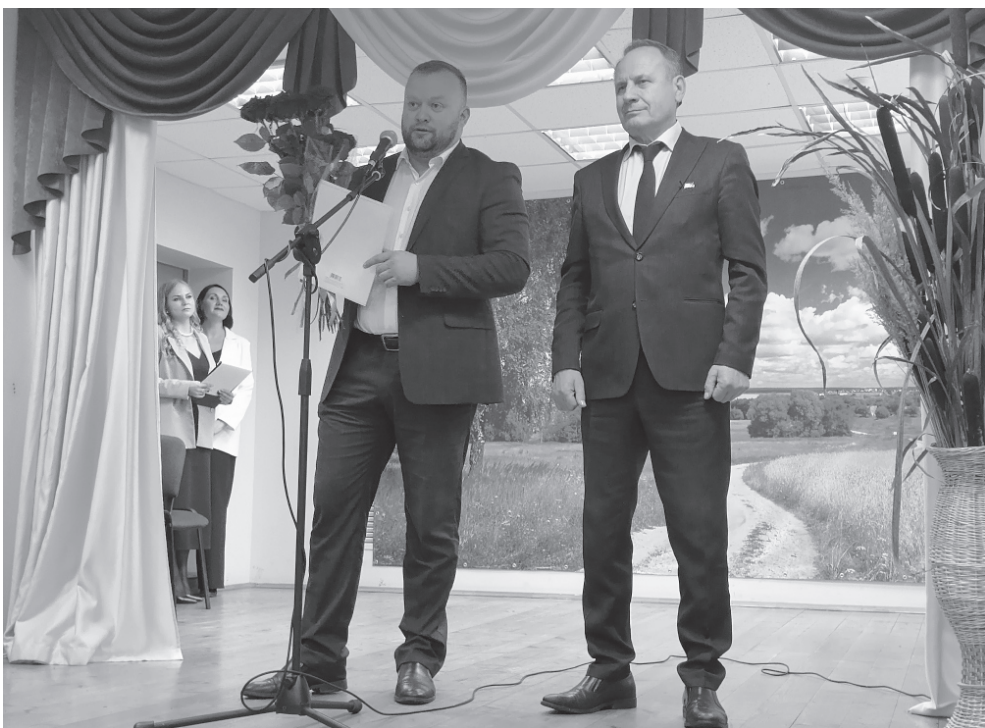
На фото: на торжественном мероприятии в Скалине

В преддверии Дня работника сельского хозяйства и перерабатывающей промышленности в ООО «Скалинский» прошло праздничное мероприятие