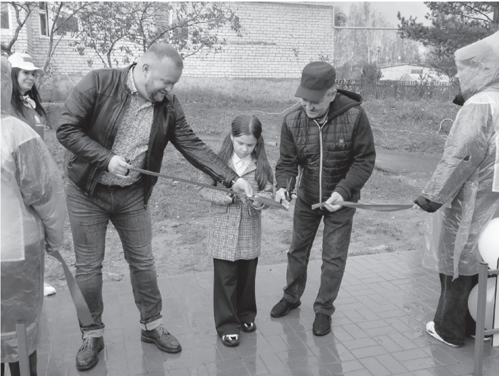
На фото: торжественное открытие площадки

Новая игровая площадка для детей – это всегда радость. А когда ее еще и открывают торжественно с играми и развлечениями – радость вдвойне.