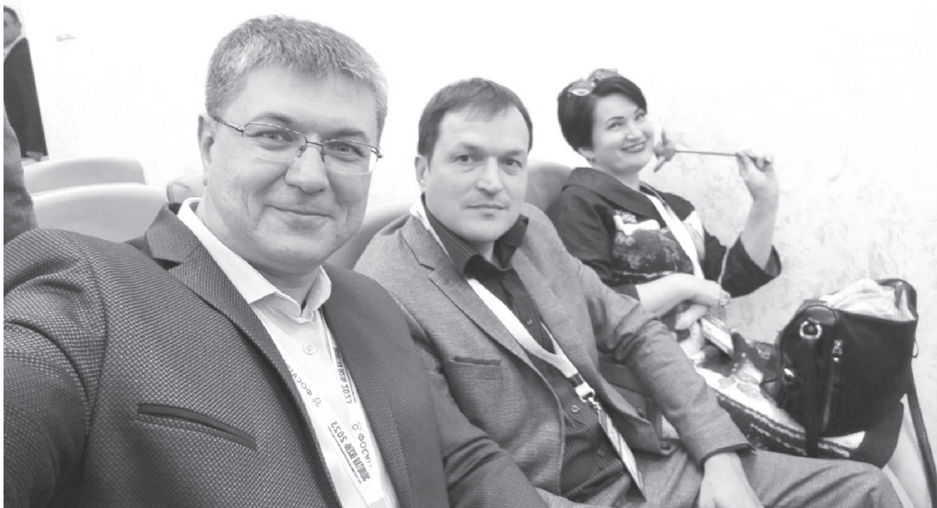
На фото: на выставке «Золотая осень-2023»