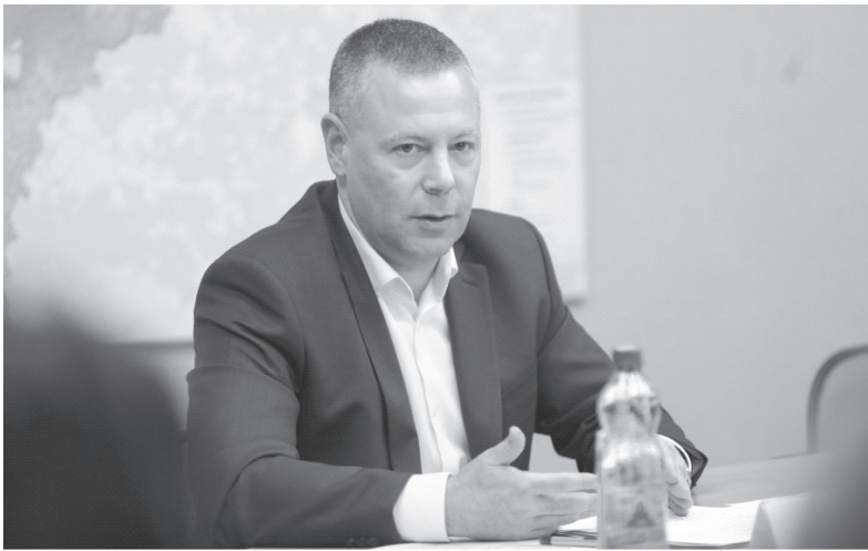
2,2 млн рублей Правительство области направит на закупку специализированного оборудования и мебели для центра амбулаторной онкологической помощи

Осенние поправки в бюджет 2023 года, инициированные главой региона Михаилом Евраевым, позволят дополнительно профинансировать сразу несколько направлений в сфере здравоохранения. Одним из них стала диагностика ВИЧ-инфекции. На приобретение специализированных тест-систем для выявления присутствия вируса иммунодефицита человека, вызывающего синдром приобретенного иммунодефицита (СПИД), лечебным учреждениям Правительство области планирует выделить 8,4 млн рублей. Тест-системы необходимы врачам для точного определения состояния здоровья ВИЧ-инфицированных пациентов, а их в Ярославской области, по данным регионального министерства здравоохранения, более 5 тысяч человек, и подбора правильного лечения.