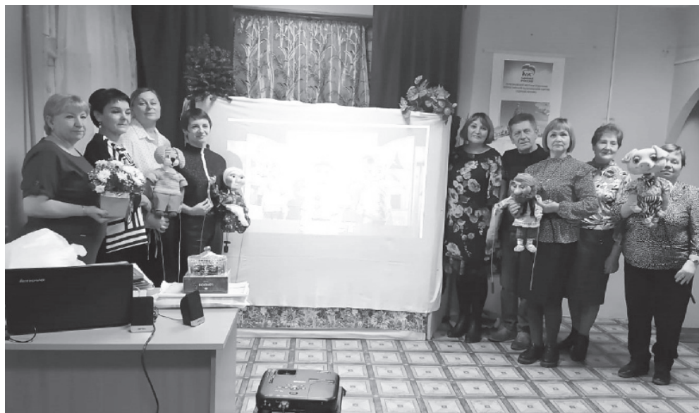
На фото: участники кукольного театра

Селяне не должны быть оторваны от благ цивилизации и жить хуже, чем жители городов. Эту непреложную истину еще в начале прошлого века пытались донести до умов больших чиновников прогрессивно мыслящие россияне. Если горожане могут посещать театры, то почему жители села нет?