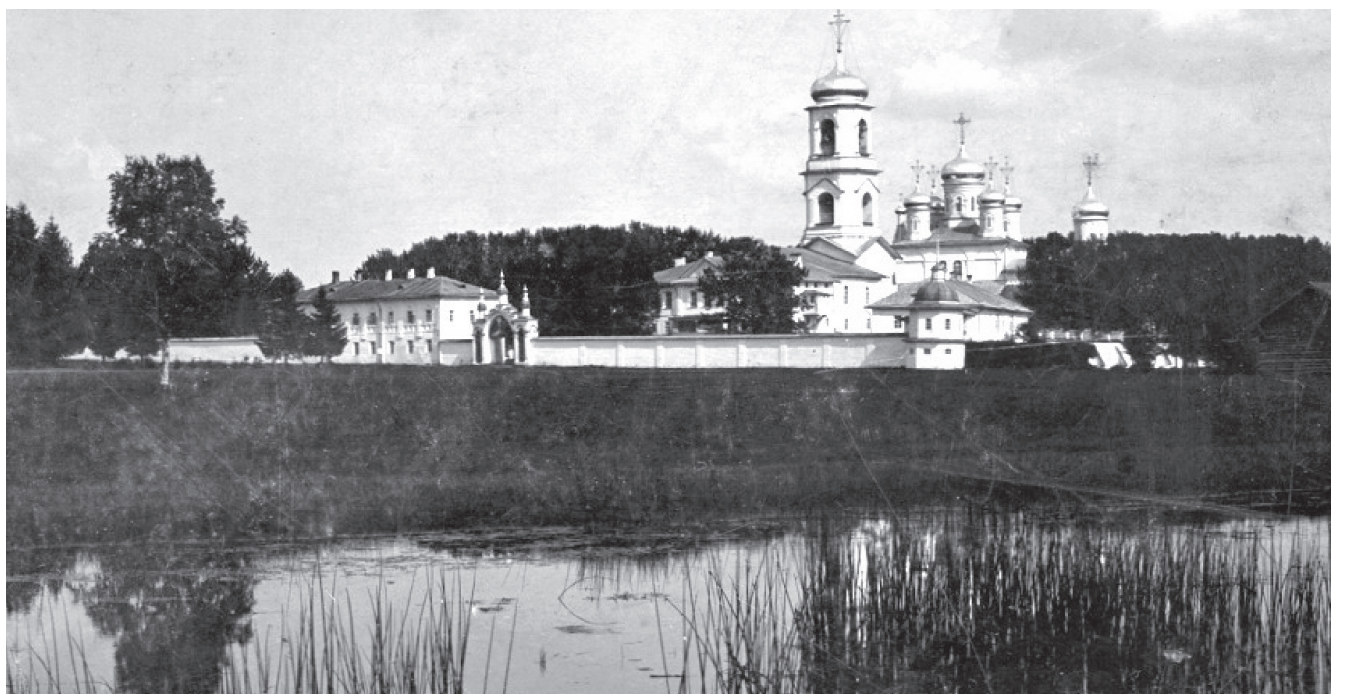
На фото: Павло-Обнорский монастырь. Вологодская область