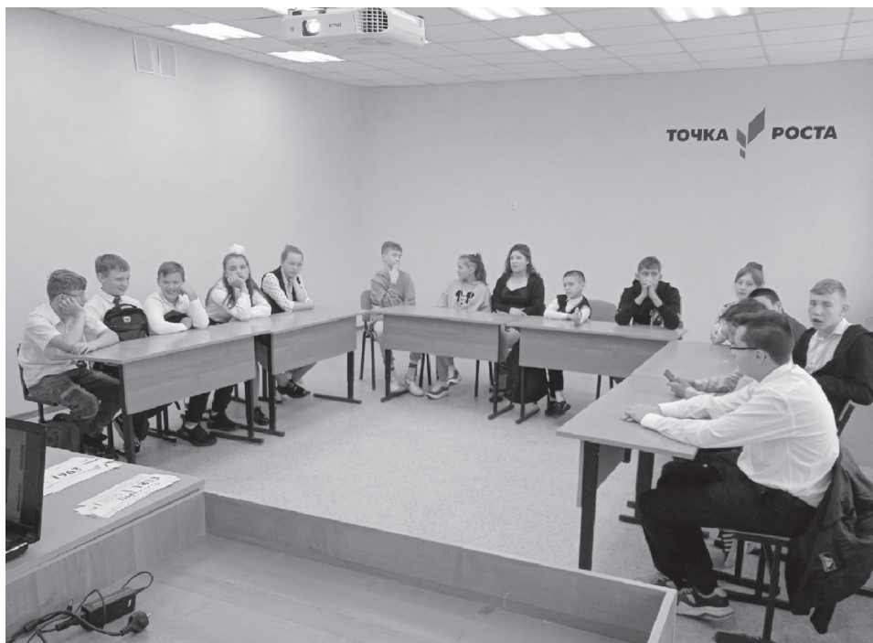
На фото: «Точка роста» теперь и в Шильпухове

1 сентября – праздник первого школьного звонка. Это самый долгожданный день и для тех, кто впервые переступит школьный порог, и для выпускников. И те, и другие готовы вступить в совершенно новую жизнь. Это праздник и для тех, кто не впервые сядет за парту, а сделает очередной шаг по длинной, но такой интересной, полной открытий школьной дороге.