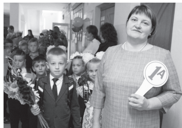
На фото: первый раз в 1 класс