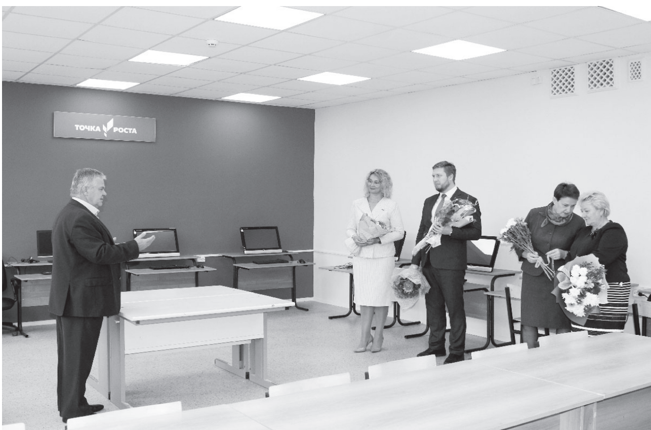
На фото: открытие образовательного центра «Точка роста» в Пречистенской школе

Пречистенская средняя школа встретила новый учебный год открытием образовательного центра «Точка роста»