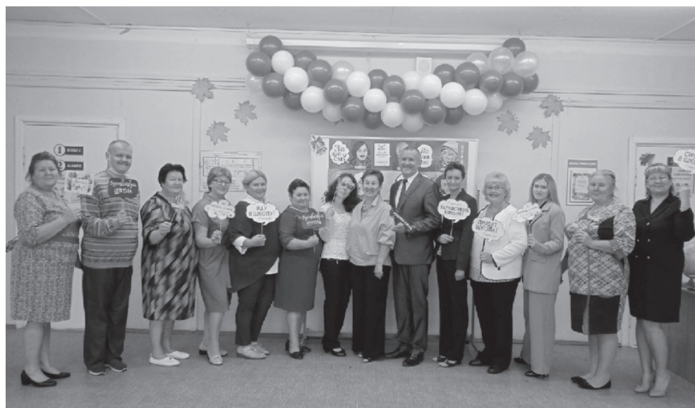
На фото: педколлектив Шильпуховской школы

1 сентября в Шильпуховской основной школе, как, впрочем, и в других школах района, прошла торжественная линейка. Говорят, как встретишь новый учебный год, так его и проведешь. В Шильпуховской школе учебный год начался ярко, интересно, насыщенно и празднично.