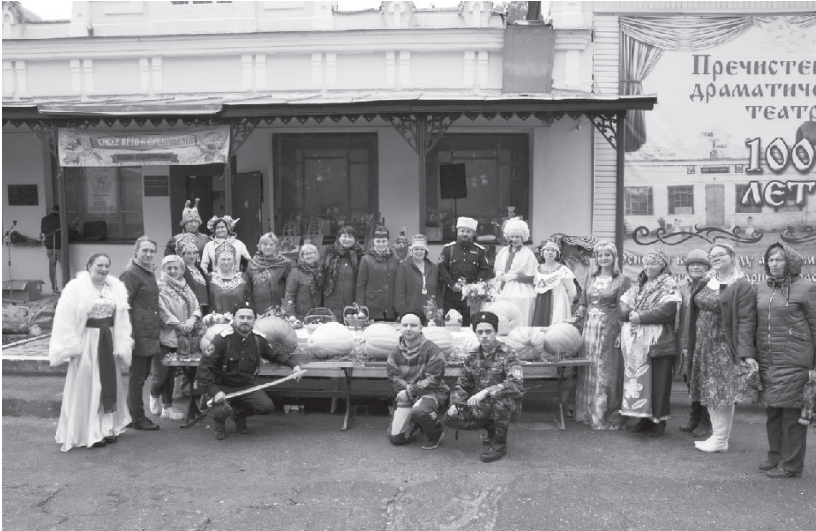
На фото: организаторы и участники действия

Задор, песни и хороводы встали на пути активно наступающего холодного ветра. Непогоде – нет! Плодово-ягодному фестивалю «Бабье лето в Пречистом» – да!