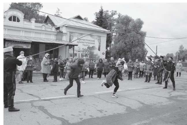
Фото с плодово-ягодного фестиваля «Бабье лето в Пречистом»