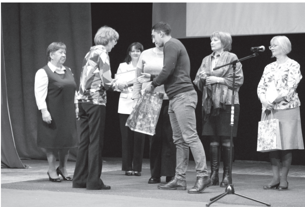
На фото: торжественное мероприятие в честь юбилея ВОИ

Среда, 29 ноября. Начало одиннадцатого, и в Первомайском МДК начинают собираться пречистенцы. Члены районного общества инвалидов идут сюда один за другим. Сегодня их день: Всероссийскому обществу инвалидов исполняется 35 лет. Собралась в этот день Первомайская районная организация Ярославской областной организации ВОИ, чтобы отметить лучших своих членов, поговорить о достижениях и победах.