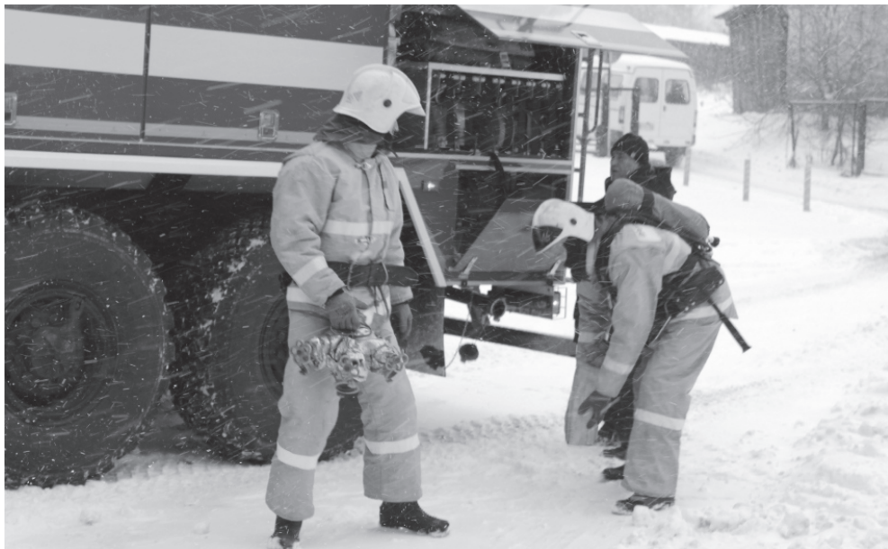
На фото: во время учений

В последний ноябрьский день жизнь в инфекционном отделении ГУЗ ЯО Пречистенской ЦРБ шла своим чередом. Больные получали назначенные врачом процедуры, медперсонал занимался своими делами. Ничто беды не предвещало. Но вот около десяти часов утра из одного кабинета вдруг повалил густой дым.