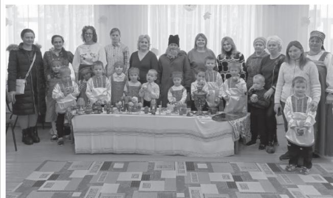
На фото: на ярмарке в Первомайской школе

Ярмарка издавна считается частью русской культуры и истории. Люди всегда возвращались с ярмарки не с пустыми руками, а обязательно с гостинцами, и, конечно, с хорошим настроением.