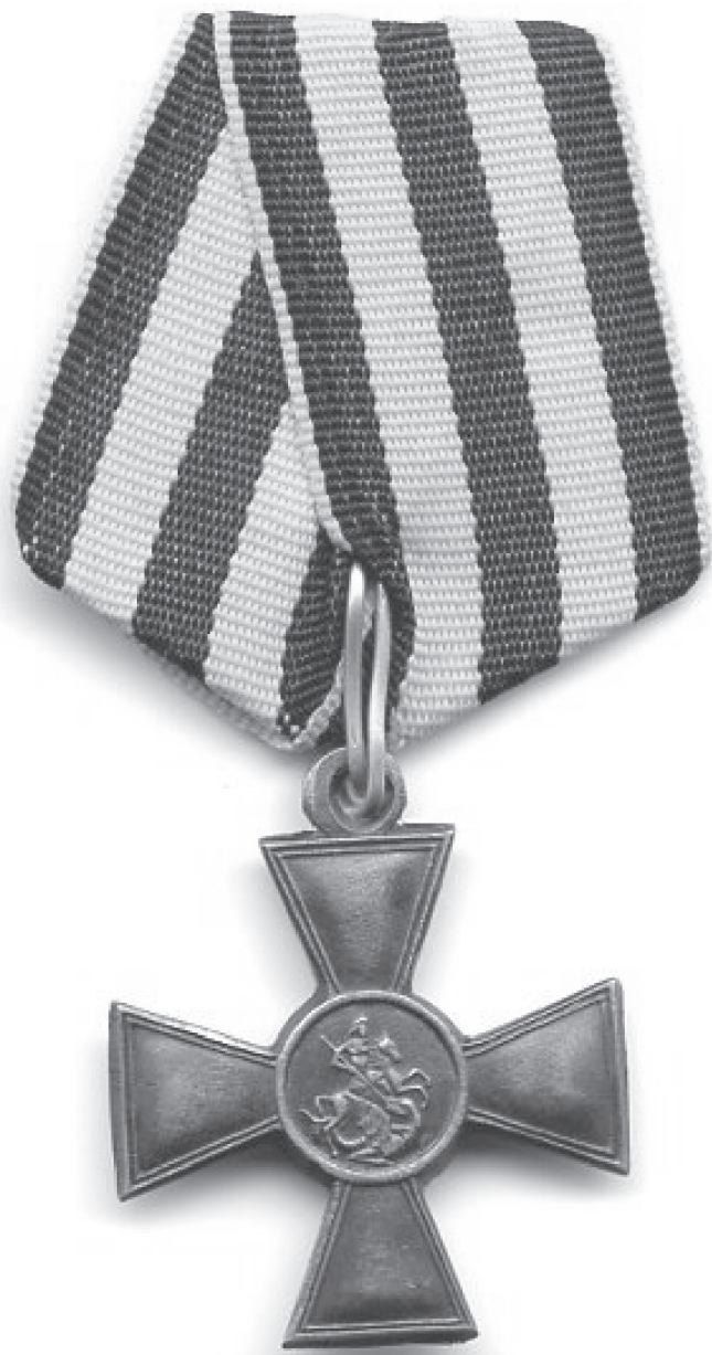
Георгиевский крест – Знак отличия Военного ордена являлся высшей наградой для солдат и унтер-офицеров за боевые заслуги и за храбрость, проявленную против неприятеля.

«К патриотизму нельзя только призывать, его нужно заботливо воспитывать» Д. С. Лихачев