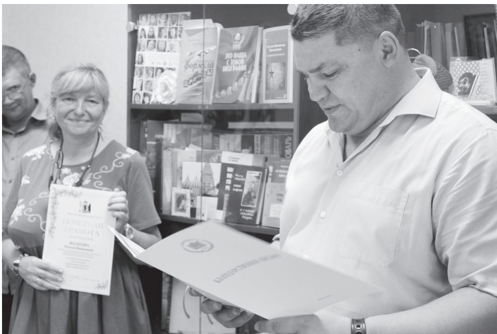
На фото: вручение Благодарственного письма коллективу редакции