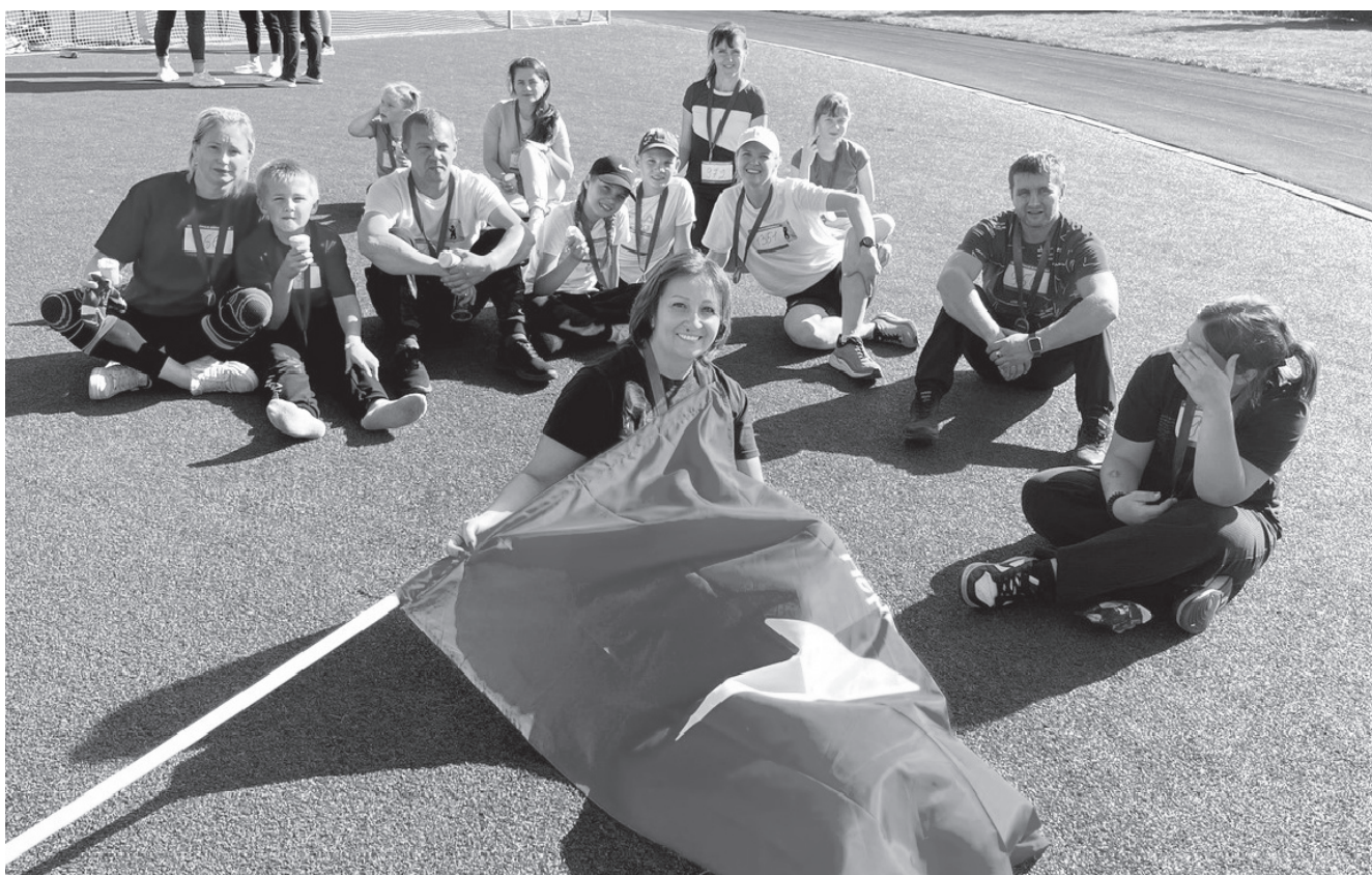
На фото: на соревнованиях

Люди среднего и старшего поколения хорошо помнят, как будучи школьниками, они сначала носили гордое имя октябрёнка, затем им повязывали красные галстуки и принимали в пионеры, а в старших классах на груди у них появлялись комсомольские значки. Принимали школьников в октябрята, пионеры и комсомольцы всегда в торжественной обстановке.