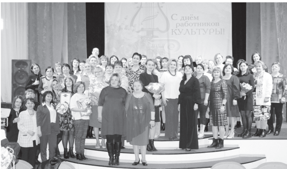
На фото: работники культуры принимают поздравления

Минувшая пятница. Полдень. В зрительном зале Первомайского МДК сидят те, кто привык смотреть на зрителей абсолютно с другой стороны – со сцены. Да, есть такой день в году, когда работники культуры сами превращаются в зрителей. И это День работника культуры, который в нашей стране отмечается 25 марта. В этом году он выпадает на понедельник, а потому работники Домов культуры, сельских клубов, библиотек, Детской музыкальной школы земли Первомайской собрались, чтобы чествовать своих коллег несколько ранее.