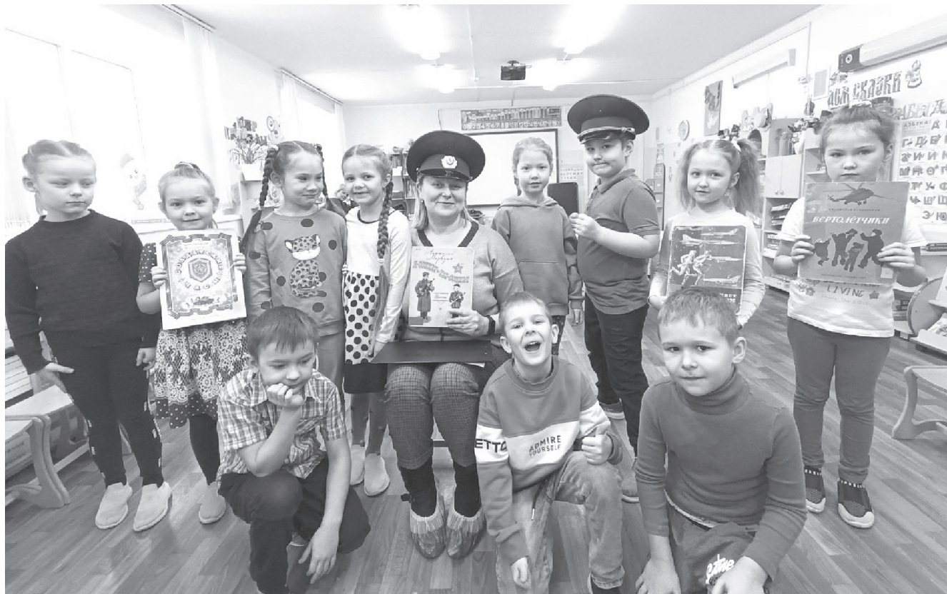
На фото: веселая детвора

Книги нашего детства. Они были такие разные – начиная от сказок и заканчивая приключенческими романами, книгами о путешествиях и повестях о любви. Конечно же, читали мы и детективы, и фантастику. Все это позволяло нам познавать мир, стремиться к совершенству, становиться лучше.