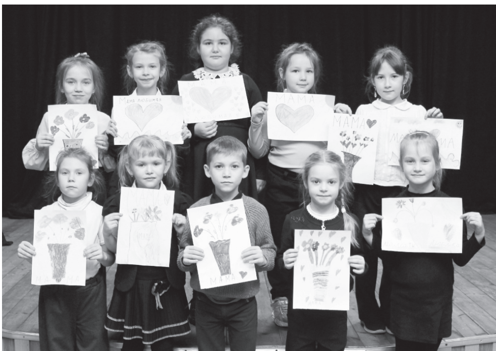
На фото: рисунки для мамы от «Супер-Деток» 1-го года обучения

«Милая моя мамочка! Спасибо тебе за жизнь! Ты у меня самая лучшая и незаменимая. Сколько бессонных ночей ты провела у моей кровати... И сегодня я хочу на весь мир прокричать, как сильно я люблю тебя!»