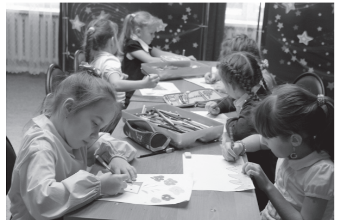
На фото: «Супер-Детки» пишут и рисуют своим мамам