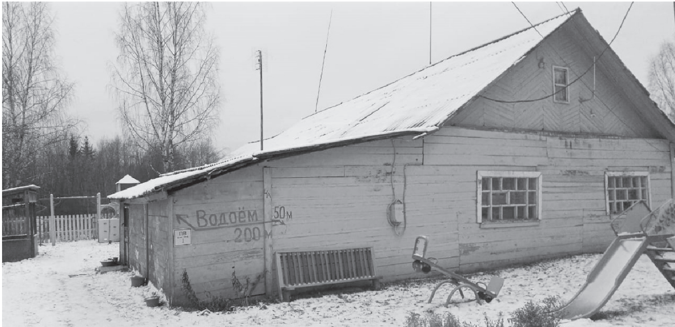
На фото: детский сад с. Николо-Гора